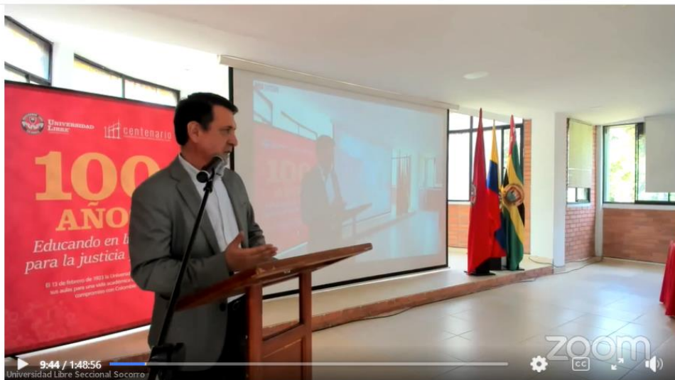
I Jornada Multicampus de Socialización de Proyectos de Investigación C...